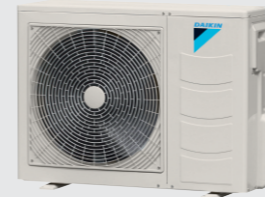
RR25 - 36AV1K 50AY1K