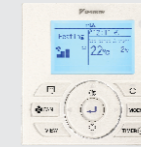
BRC51A62Y Wired Remote Control